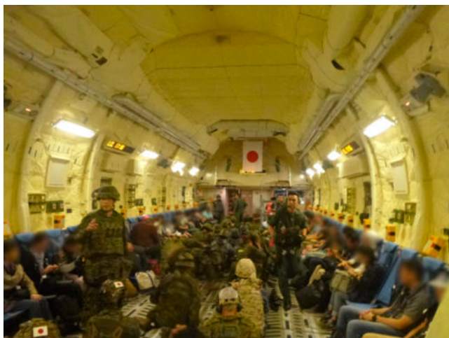
スーダンからジブチへ向かう空自C-2輸送機の機内の様子

□ 参照 Ⅱ部6章3項6(在外邦人等の輸送・保護措置)、資料22(在外邦人等の輸送実績・自衛隊による在外邦人等の輸送の実施について(令和4年4月22日閣議決定))