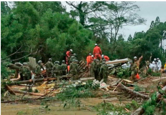
人命救助にあたる隊員

参照 II部6章4項（災害派遣など）、図表Ⅲ-1-7-1（要請から派遣、撤収までの流れ及び政府の対応）