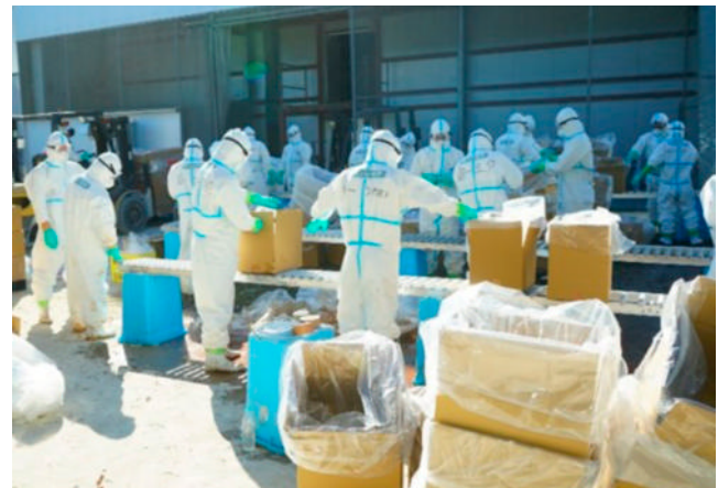
養鶏場における殺処分などの支援にあたる隊員