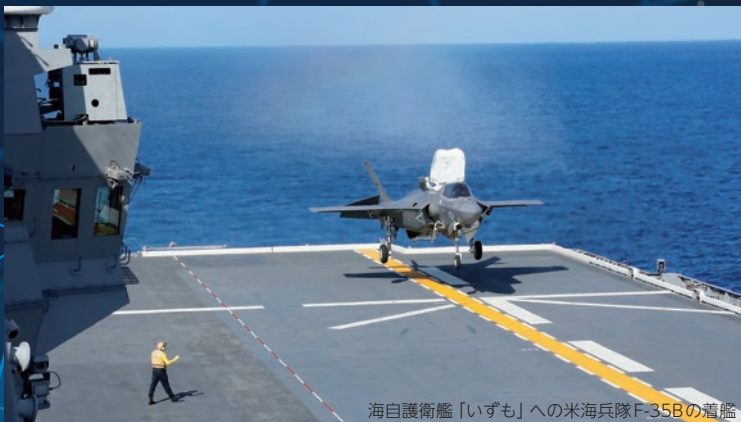
海自護衛艦「いずも」への米海兵隊F-35Bの着艦

◆ わが国の防衛力を主体的・自主的に強化しつつ、宇宙やサイバーを含む幅広い領域・分野において協力を深化し、日米同盟の抑止力・対処力を強化しています。