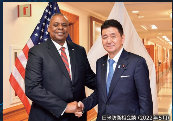
日米防衛相会談(2022年5月)