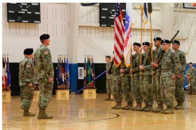
I2CEWS部隊創設における式典の様子【米陸軍】

米軍の組織においては、2019年、国防長官のもとに電磁スペクトラム作戦機能横断的チーム(Electro Magnetic Spectrum Operation Cross Functional Team)を立ち上げるとともに、陸軍が同年1月、情報・宇宙・サイバー・電子戦任務などを統合したマルチドメイン任務部隊の一部分を構成するI2CEWS部隊を新たに創設している。