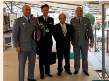
モロッコ軍による記念艦三笠の視察に 同行する筆者 （筆者：左から2人目）

家であり、独立以降、日本とは良好な関係を維持しているとともに、地中海の出入口に位置する軍事戦略的要衝として、世界中から多くの武官が派遣されています。