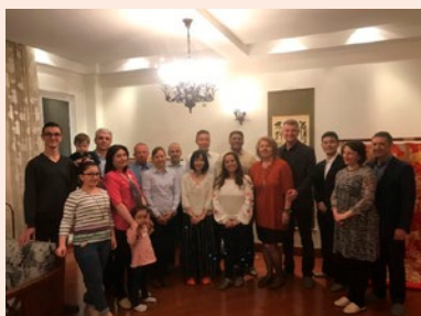
武官団との交流（自宅設宴） （筆者：右から8人目）

正規軍と革命ガードの2つの軍が存在し、昨今の中東情勢の中心でもあるイランという特徴的な国に駐在するただ一人の自衛官として、絶