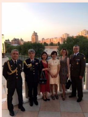
レセプションで各国武官と （筆者：左から2人目）

中央アジアの雄といわれるカザフスタンの防衛駐在官として、当地におけるロシア、中国、欧米諸国等の各種軍事動向に注視する日々を送っています。帝政ロシア時代からの歴史的経緯により、ロシアとの繋がりが強固なカザフスタンですが、全方位外交を指向し日