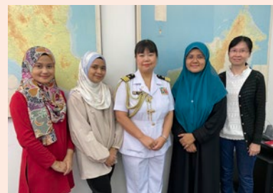
在マレーシア大使館現地職員と筆者 （筆者：中央）

19（平成31）年3月からインド洋と太平洋をつなぐ地政学的要所にあるマレーシアに初の海上自衛隊出身の防衛駐在官として勤