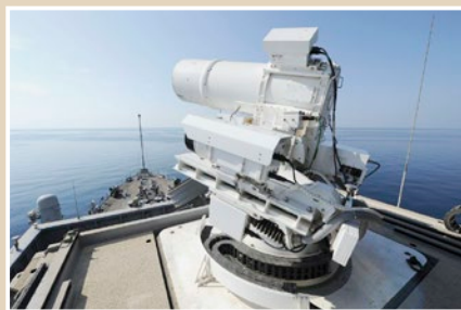
【Jane's by IHS Markit】