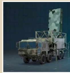
【Jane's by IHS Markit】

〈概説〉 スウェーデン、サーブ社のジラフ8Aは自動的に最も妨害を受けにくい周波数を選択可能