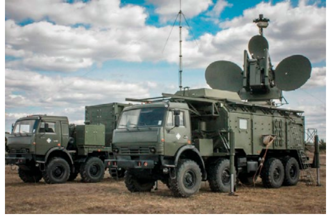
クラスハ-4【Jane's by IHS Markit】

破壊などの非電子的要素を統合指揮のもとにおくという構想を掲げている 2 。そのうえで、複雑な電磁環境下において効果的に任務を遂行できるよう演習を実施しており、実戦的な能力を向上させている。なお、軍全体の作戦遂行能力の向上のために新設された「戦略支援部隊」が電子戦・サイバー・宇宙などの分野を担当するとみられる。