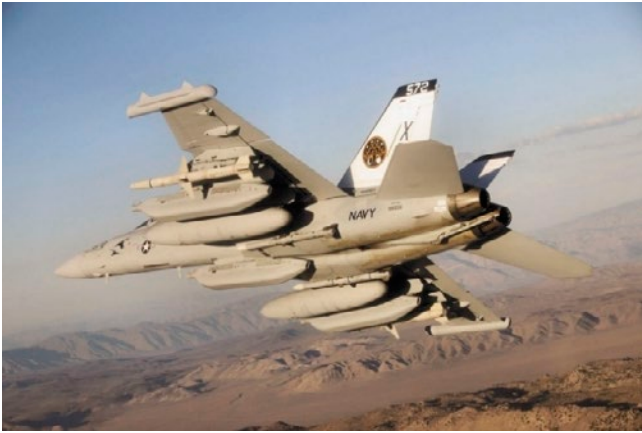
EA-18G グラウラー