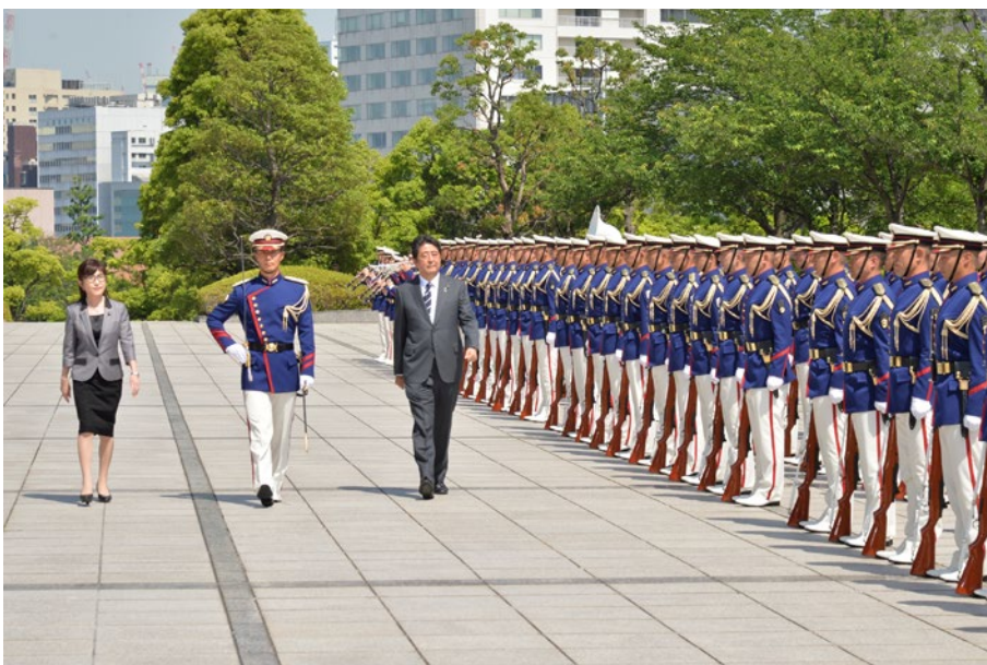
特別儀仗隊を巡閲する安倍内閣総理大臣と稲田防衛大臣

わが国は、このような防衛力の役割を認識したうえで、様々な分野における努力を尽くすことにより、わが国の安全を確保するとともに、アジア太平洋地域、ひいては世界の平和と安全を目指している。