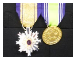
(左) 第1級防衛功労章 (右) 特別部隊功績貢献章