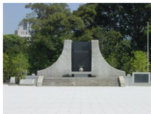
殉職者慰霊碑（午前のみ）