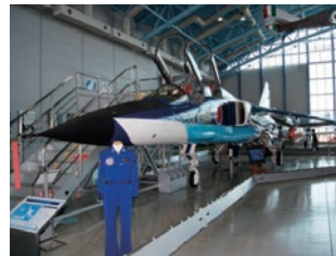
館内に展示されている航空機