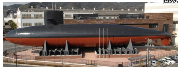
展示されている潜水艦