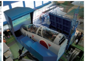
フライト・シミュレータ