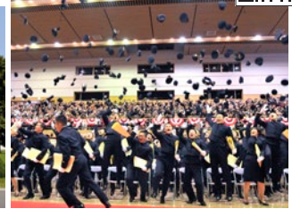
記念講堂での卒業式