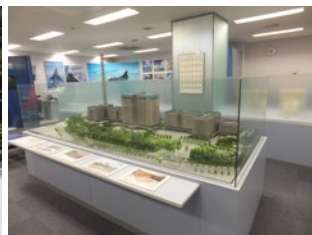
広報展示室（午後のみ）