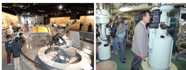
館内の装備品展示