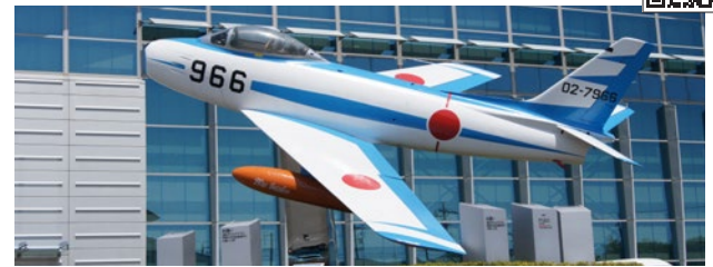
施設前に展示されている航空機