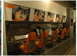
館内の展示 (左は零戦の実機)