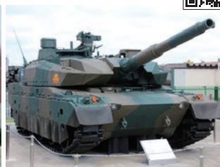
屋外の装備品展示