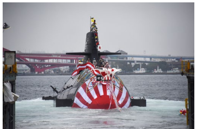
潜水艦「せきりゅう」命名進水式

常時継続的な情報収集・警戒監視・偵察活動(常統監視)や対潜戦などの各種作戦の効果的な遂行により、周辺海域を防衛し、海上交通の安全を確保するとともに、国際平和協力活動などを機動的に実施し得るようになる。このため、1隻のヘリコプター搭載護衛艦と2隻のイージス・システム搭載護衛艦を中心として構成される4個の護衛隊群に加え、その他の護衛艦から構成される5個の護衛隊を保持する。また、潜水艦増勢のために必要な措置を引き続き講ずる。