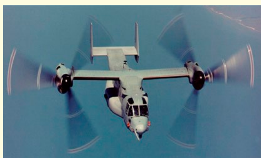
写真は米海兵隊オスプレイ（MV-22）

また、水陸両用車は、島嶼への侵攻があった場合にこれを速やかに奪回・確保するため、一定の脅威下においても自らを防護しつつ海上から所要の部隊を上陸させることが可能です。