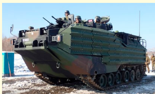
水陸両用車（参考品）