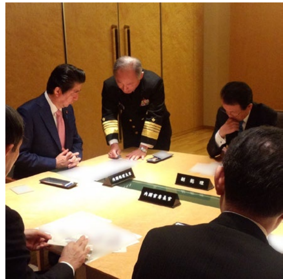
北朝鮮の弾道ミサイル発射事案について開催された国家安全保障会議の様子