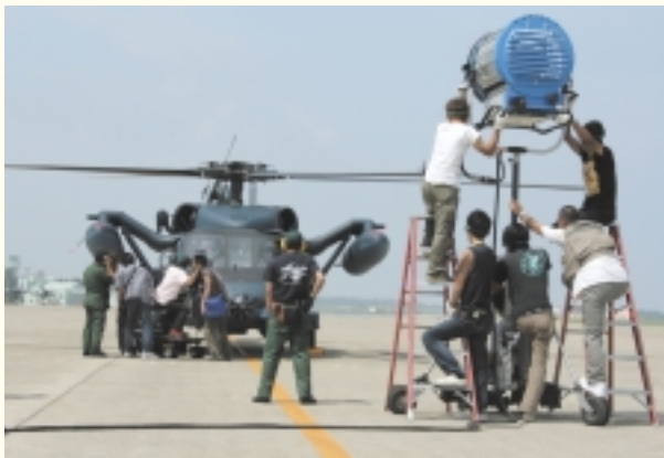
小松基地における撮影風景