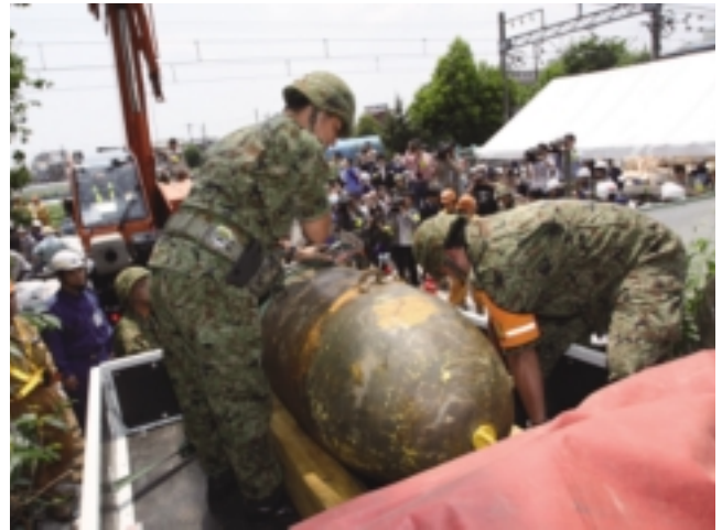
不発弾処理（調布市）に従事する陸自隊員