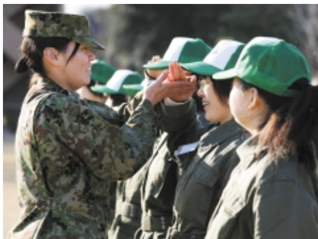
部隊における生活体験