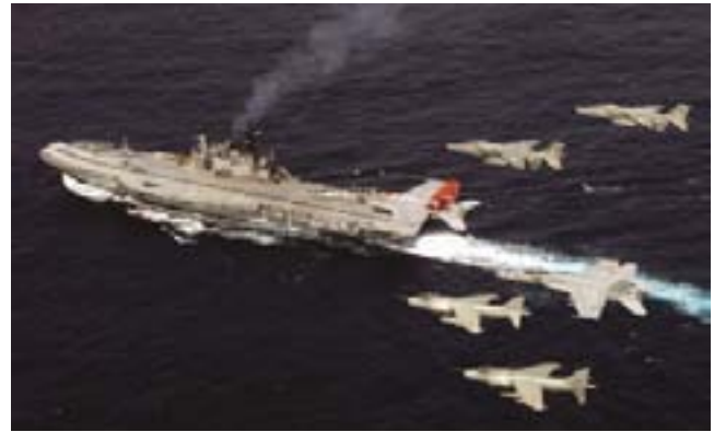
「マラバール07-2」の様相

インドは、中国との間では国境問題を抱えており、また、中国の核やミサイル、海軍力を含む軍事力の近代化の動向に対して警戒感を示しているものの、両国首脳に