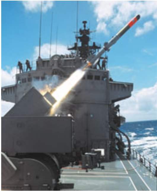
アスロックミサイルを発射する海自護衛艦

哨戒機による広い海域の哨戒 1 や、護衛艦などによる船舶の航行海域などの哨戒を行う。わが国の船舶などを攻撃しようとする敵の水上艦艇や潜水艦を発見した場合は、護衛艦、潜水艦、哨戒機などによりこれを撃破する（対水上戦、対潜戦）。状況により戦闘機の支援を受ける。