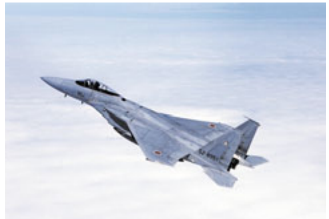
飛行中の空自F-15戦闘機

全般的な防空においては、敵の航空攻撃に即応して国土からできる限り遠方の空域で迎え撃ち、敵に航空優勢 2