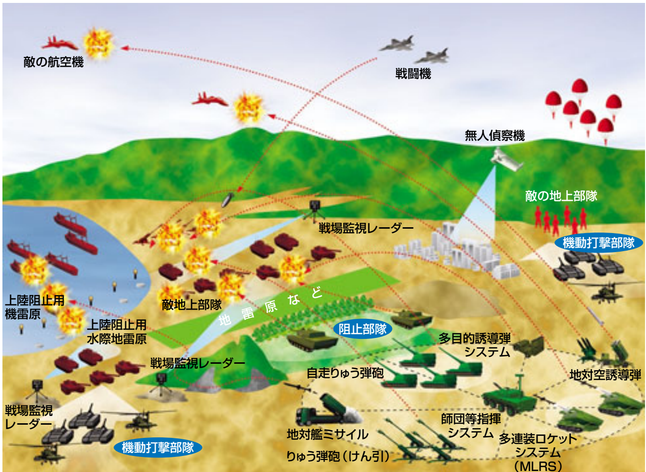
図表Ⅲ-1-3-3 着上陸侵攻対処のための作戦の一例