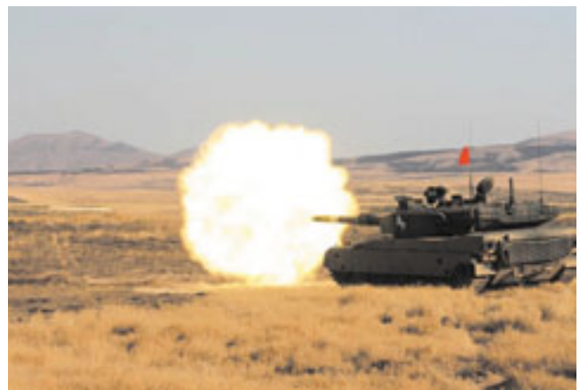
射撃中の陸自90式戦車