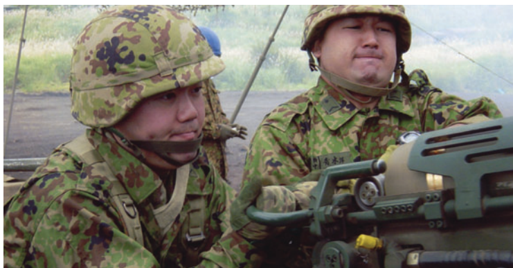
訓練中の即応予備自衛官