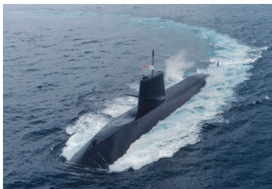
水上航走中のおやしお型潜水艦