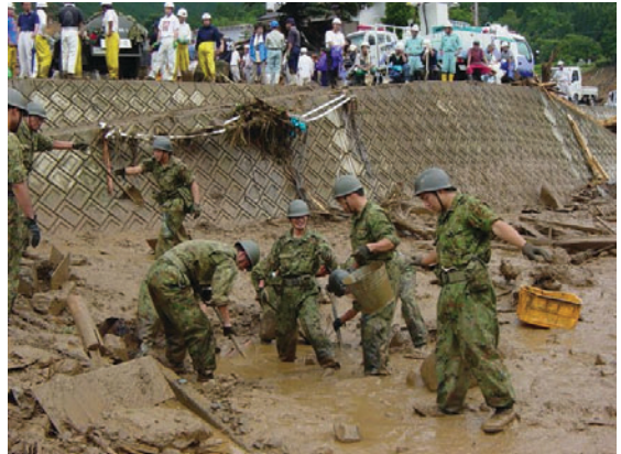
水俣地区の集中豪雨に伴う災害派遣活動を行う第8特科連隊の隊員（昨年7月）

また、周辺地域でわが国の平和と安全に重要な影響を与えるような事態が発生した場合は、憲法と関係法令に従い、必要に応じて国連の活動を適切に支持しつつ、日米安保体制の円滑かつ効果的な運用を図ることなどで適切に対応する。